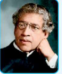
जगदीश चंद्र बसु

रेडियो के विकास में भारत का योगदान: वेसे तो पहला व्यावहारिक रेडियो 1895 में गुग्लिएल्मो मार्कोनी द्वारा बनाया गया था, लेकिन भारतीय वैज्ञानिक जगदीश चंद्र बसु ने 1895 में बिना तार के सिग्नल भेजने का प्रदर्शन कर दिया था। भारत में पहला रेडियो प्रसारण जून 1923 में बॉम्बे रेडियो क्लब द्वारा किया गया था। अपने देश का ऑल इंडिया रेडियो 99 प्रतिशत जनसंख्या तक पहुंच के साथ दुनिया के सबसे बड़े प्रसारकों में से एक है।